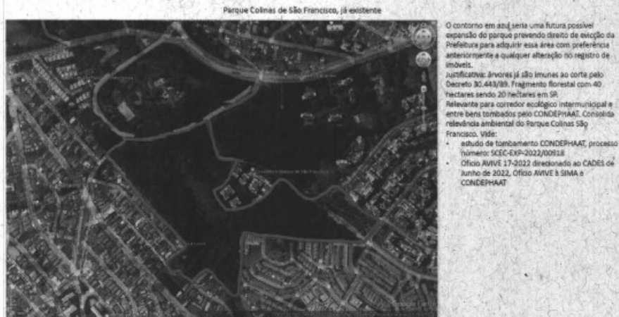
Imagem 01: Vista por satélite Google Earth do Bairro Vila São Francisco, Parque Colinas e Região

Requeremos que seja incluído no Quadro 7 e Mapa 5 do Plano Diretor mais um parque na Subprefeitura do Butantã, distrito do Rio Pequeno, ou ainda que o Parque Colinas seja ampliado, em ambos os casos para que o parque absorva esta área indicada em azul e em verde (VIDE IMAGEM 01), eis que é área de Remanescentes do Bioma da Mata Atlântica, já identificadas pelo PMMA – Plano Municipal da Mata Atlântica, no GEOSAMPA (VIDE IMAGEM 02) e precisamos seguir com específicas inclusões protetivas dessas áreas no Plano Diretor em Revisão.